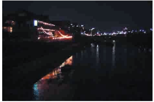
十五夜に川床料理を楽しむ 長崎大会が楽しみ