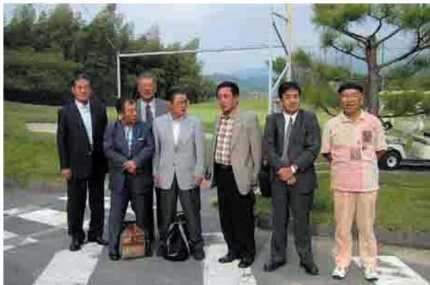
楽しい一夜が明けて、それぞれ.....