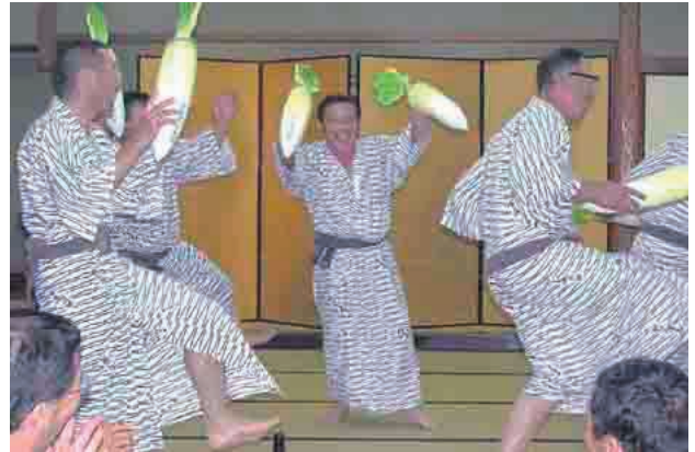
やっぱり出た ダイコンおどり